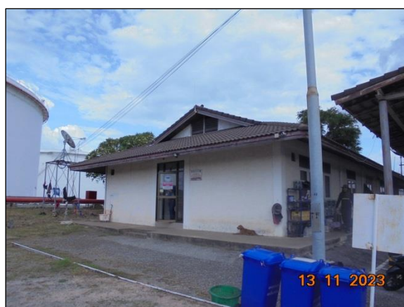
อาคารสำนักงานและทำแท็บเรือ