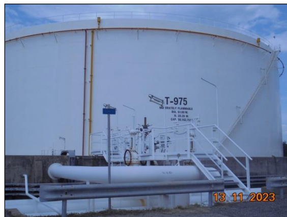
ถังเก็บน้ำมันภายในพื้นที่โครงการ